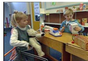
Figuur 4, handelingsniveau 1: ‘Informeel handelen’

Als je wilt werken aan de begripsvorming dan is het zaak om te starten met de eerste fase, ‘informeel handelen in werkelijkheidssituaties’: handelend rekenen in concrete situaties. Het mooiste is als leerlingen in de praktijk ervaringen met betalen opdoen of in situaties die de praktijk zoveel mogelijk benaderen. Een bezoek aan een echte winkel of het inrichten van een winkel op school zijn daar voorbeelden van. Een voorbeeld van informeel handelen bij de leerlijn Geld is ‘Winkeltje spelen’ in de klas. Eén persoon is de cassiére en leerlingen mogen spulletjes bij de cassiere kopen en afrekenen. De begrippen ‘kopen’/ ‘afrekenen’, ‘hoeveel is dat samen’/ ‘betalen’ etc. komen op die manier aan de orde. Voor de leerlingen wordt het heel visueel wat er gebeurt als je iets koopt. Het is belangrijk dat de leerlingen vertellen wat er gebeurt in de winkel. Op die manier leren zij de begrippen hanteren en te koppelen aan de handeling. Ook bijvoorbeeld het oefenen met de opbouw van getallen kan door middel van namaakgeld. Leerling krijgen de opdracht om bedragen samen te stellen met geld of om bijvoorbeeld bedragen op verschillende manieren neer te leggen, zoals een briefje van 10 euro is evenveel als 5 losse munten van 2 euro.