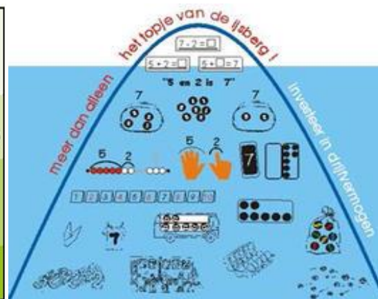
Figuur 2, ijsbergmodel

In de eerste twee fasen gaat het om (handelend) rekenen in concrete situaties. Dit is de onderste en basale fase in het handelingsmodel en geldt als voorwaarde voor het handelen en functioneren op de twee hoogste niveaus. In de fasen erna worden kennis en effectieve strategieën (met behulp van denkmodellen) vanuit de concrete situatie geabstraheerd en geautomatiseerd zodat ze herkend worden en leerlingen uiteindelijk een rekenbewerking op formeel niveau kunnen uitvoeren.