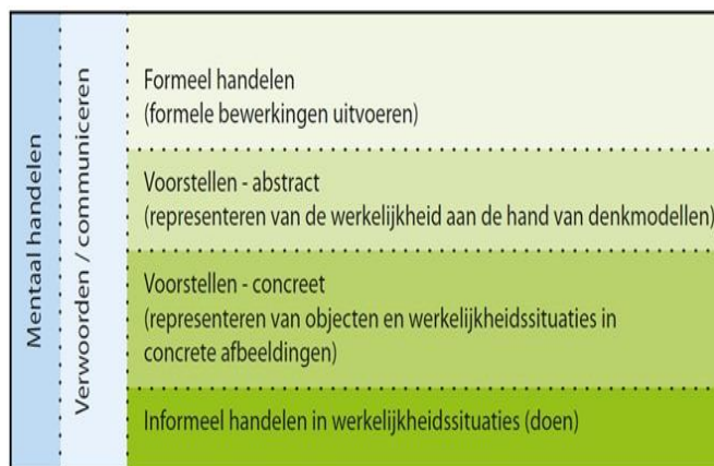
Figuur 1, handelingsmodel

De rekenontwikkeling verloopt in vier fasen. Dit wordt weergegeven in het handelingsmodel (figuur 1). Het ijsbergmodel (figuur 2) geeft een visuele uitwerking van het handelingsmodel, aan de oppervlakte zien we de bewerkingen (formele sommen) en onder de oppervlakte zien we de begrippen en procedures die ze nodig hebben om deze bewerkingen uit te kunnen voeren.