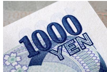
Euro, Britse pond & Japanse Yen