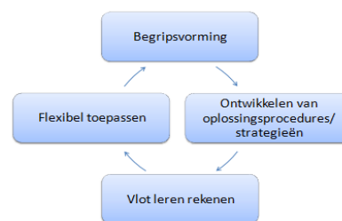
Figuur 3, Het hoofdlijnenmodel

In de opbouw van een leerlijn rekenen, bijvoorbeeld de leerlijn Geld, is te zien dat er in verschillende fasen aandacht wordt besteed aan deze vier hoofdlijnen. De hoofdlijnen volgen elkaar op en hebben een cyclisch verloop. Elke volgende fase in het leerproces gaat uit van beheersing van de voorafgaande fase. De vier hoofdlijnen haken dan ook als opeenvolgende schakels aan elkaar (Groenestijn, Borghouts & Janssen, 2011). De begripsvorming is de basis voor het leren rekenen; je moet begrijpen wat er gebeurt als je bijvoorbeeld gaat rekenen met geld. Bij de leerlijn geld leert de